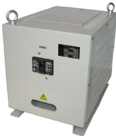
WTC-5K: プレーカーは特別注文