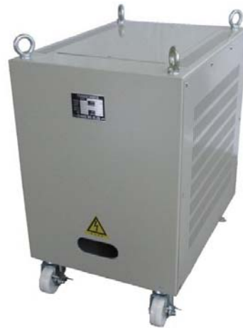
WTC-10K: キャスターは特別注文